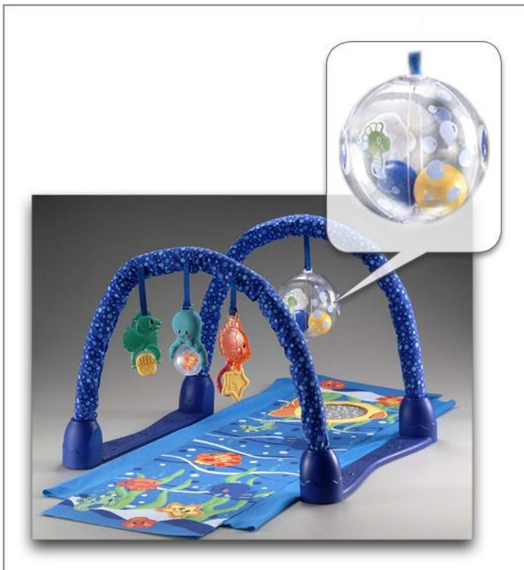
C3068 Ocean Wonders Kick & Crawl Aquarium