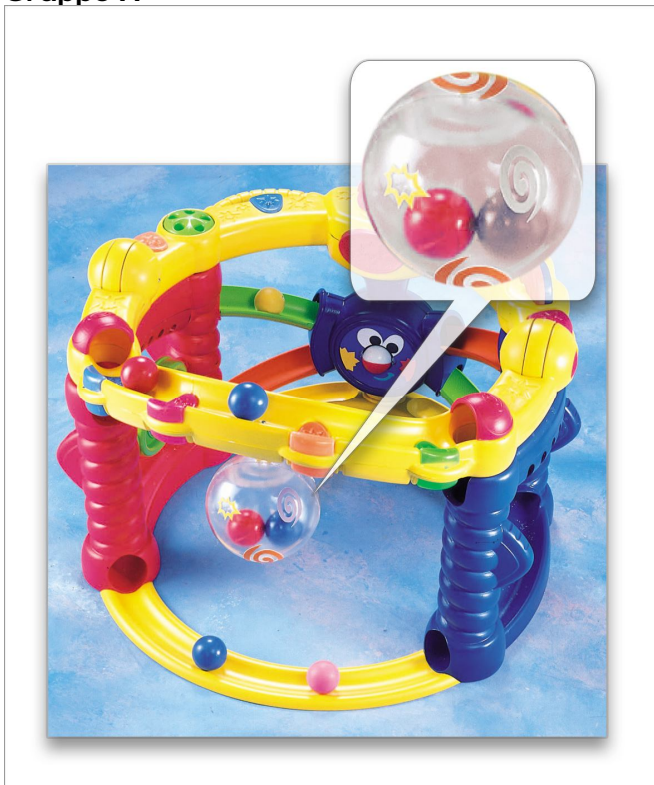
73408 The Baby Playzone Crawl & Cruise Playground