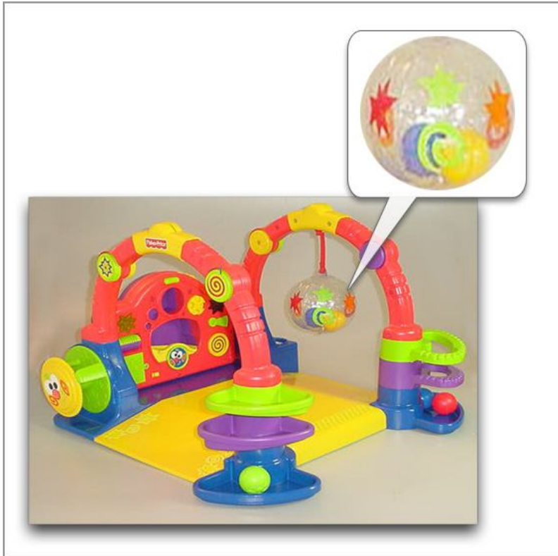
B2408 Baby Playzone Crawl & Slide Arcade