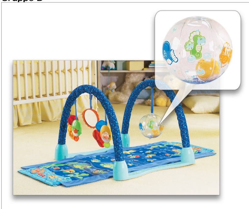
H8094 Ocean Wonders Kick & Crawl Aquarium

Ingen øvrige Fisher-Price-produkter med oppblåsbare baller er berørt av denne tilbakekallingen.