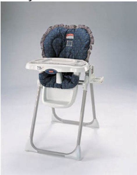
Healthy Care™ Barnstol