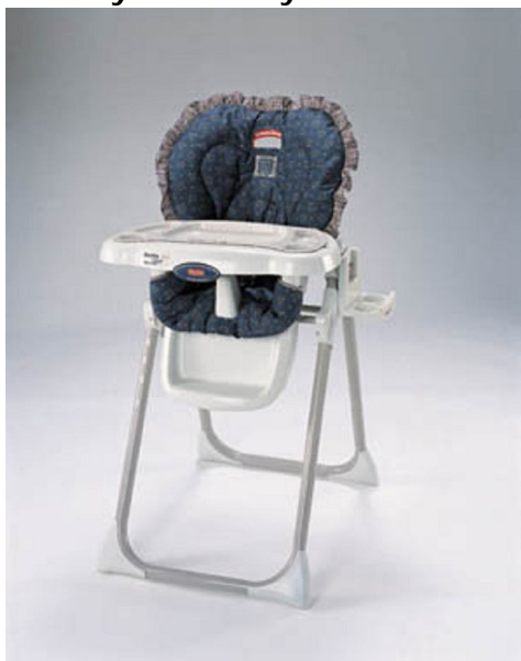
Healthy Care™ -syöttötuoli